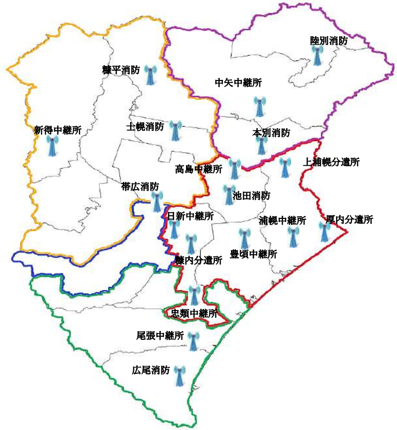
無線基地局配置状況